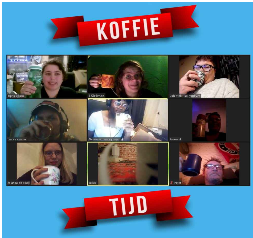
N.B. Tijdens de Zoom-sessies maken we af en toe thema-screenshots voor op de socials