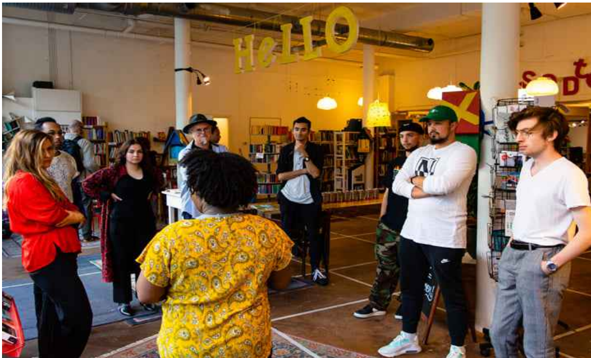
Sunshine geeft de deelnemers van de tweede voorronde instructie.

Daarom hebben we in overleg met het team besloten dat Poetry Slam Rotterdam volgend jaar verder gaat onder een eigen stichting. Wij kijken met trots terug op deze mooie samenwerking.