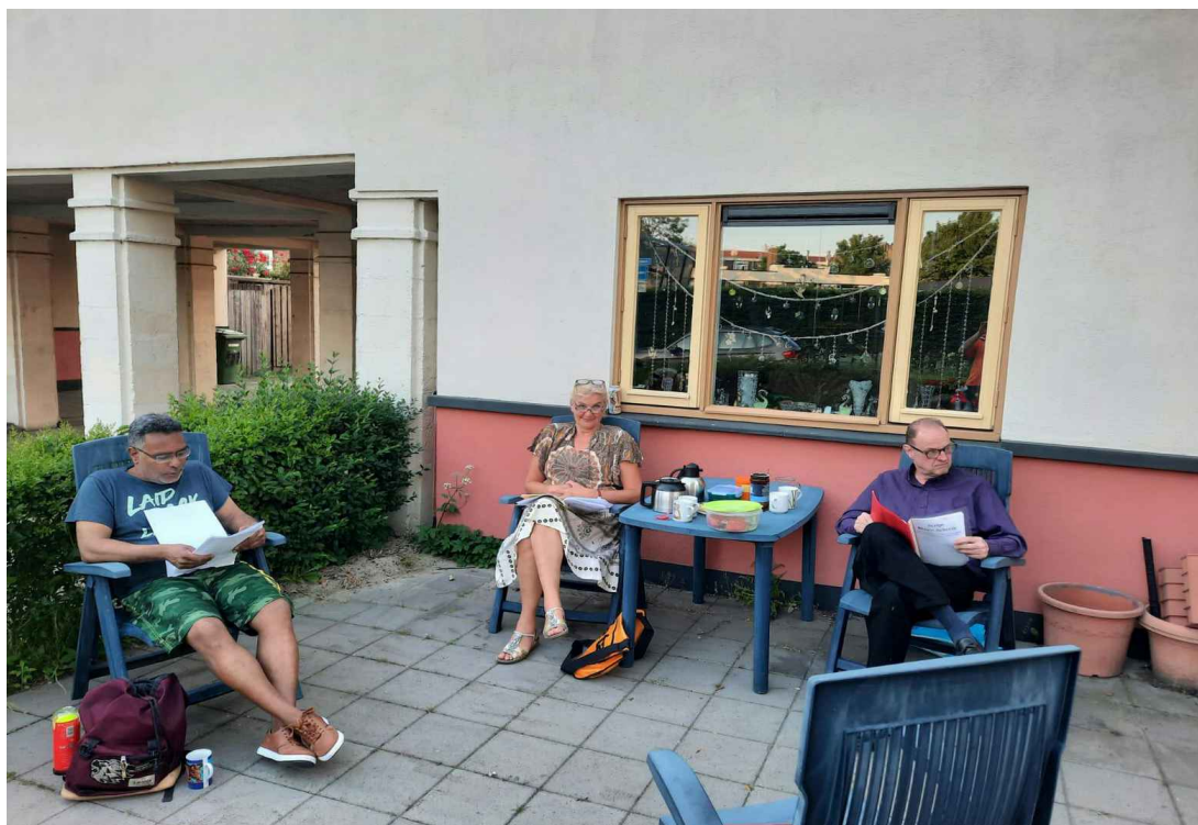
Repeteren in de voortuin